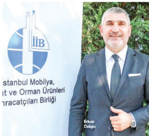
İstanbul Mobilya, Kağıt ve Orman Ürünleri İhracatçıları Birliği

Üretim, istihdam ve ihracatta gerçekleştirilen istik-