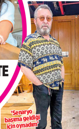
'Senaryo başıma geldiği için oynadım'

"Eskilerden herkesin çok sevdiği bir şarkıyı yeniden seslendireceğim. Ayrıca, Seda Savaş ile bir düet yapacağız. Şarkının söz ve müziği Yıldız Tilbe'ye ait" diyerek sevenlerine sürpriz yaptı. Her zamanki zarafeti ve içtenliğiyle gazetecilere teşekkür ettikten sonra alışveriş merkezinden ayrıldı.