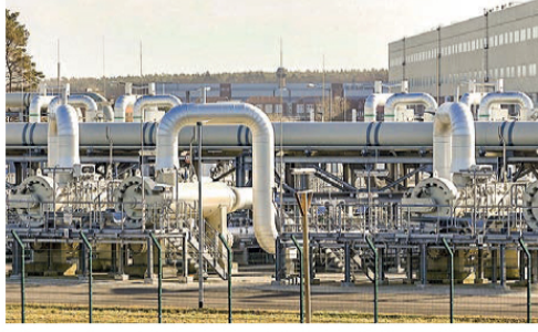
Bulgaristan'a gaz tedariki sağlıyoruz" dedi.

Bu durumun Avrupa'daki gaz fiyatlarını artırabileceğine değinen Bayraktar, "Biz mümkün olduğu kadar farklı kaynaklardan gaz ülkemize alarak, çeşitlendirerek, tedarik portföyümüzü genişleterek kendi arz güvenliğimizi sağlarken bir taraftan da ilave oluşabilecek kapasiteyi Avrupa'ya sevk etmeye çalışıyoruz. Buna başladık. Birkaç ülkeye ihracat yapmaya başladık. Türkiye'den doğal gaz satıyoruz. Onun dışında Macaristan, Romanya,